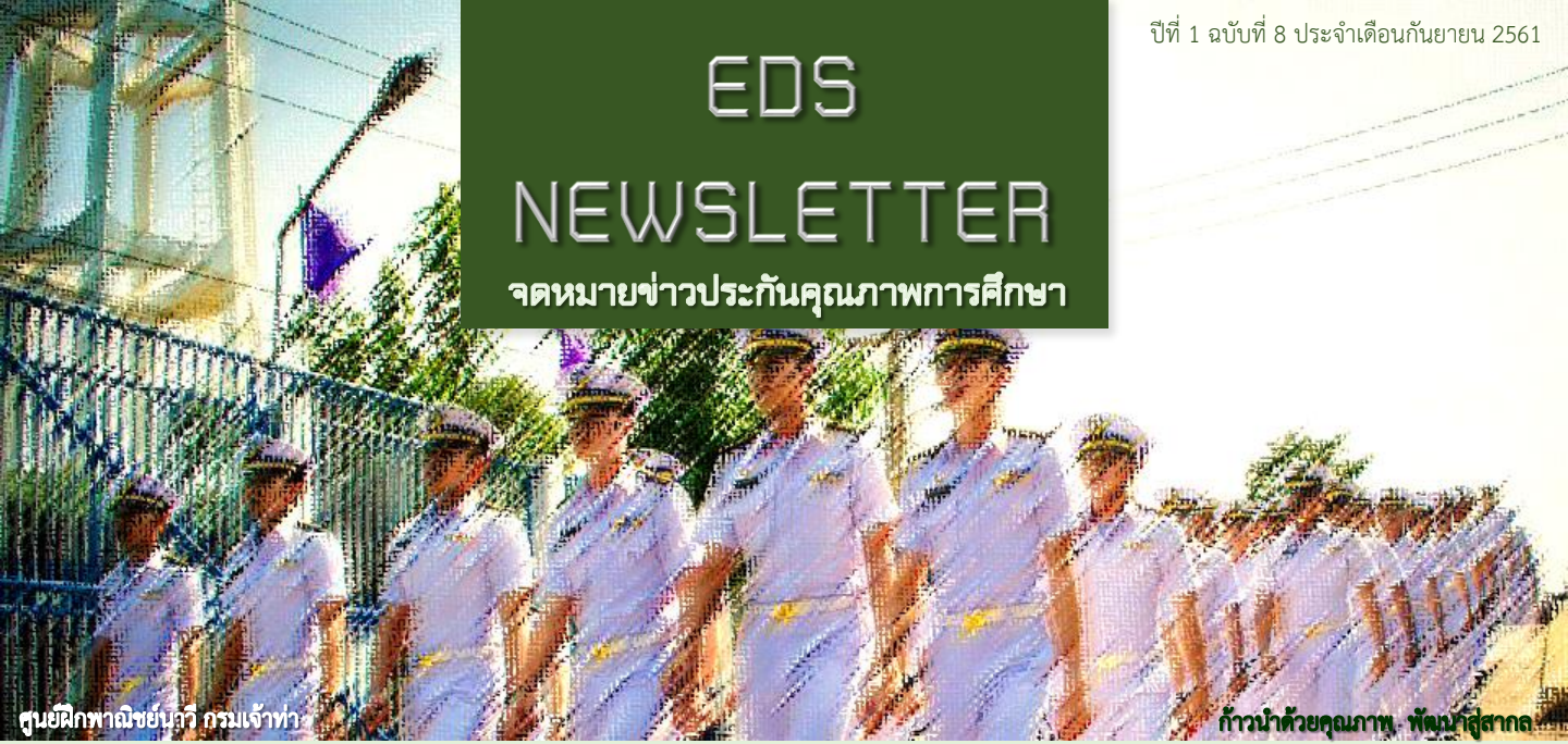
ศูนย์ฝึกพลาซายอนแก้ว กรมเจ้าท่า